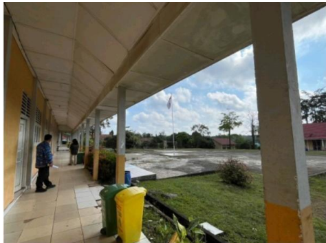
Gambar 1. Kegiatan Pengecekan Sarana dan Prasarana Sekolah

Terdapat dokumentasi kegiatan pengecekan ruang kelas, fasilitas belajar siswa, serta lingkungan sekolah oleh pihak sekolah. Dokumentasi tersebut juga memperlihatkan keterlibatan kepala sekolah dan petugas sarana prasarana dalam memastikan kondisi fasilitas sekolah tetap terjaga dengan baik.