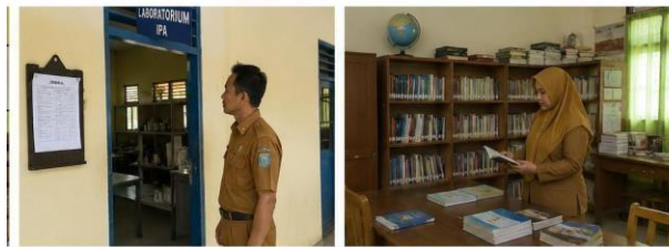
Gambar 4. Kegiatan Pengawasan Sarana dan Prasarana Sekolah

Berdasarkan dokumentasi pada Gambar 4 dapat disimpulkan bahwa pihak sekolah sedang melaksanakan kegiatan pengawasan sarana dan prasarana sebagai bentuk pemeliharaan fasilitas sekolah. Dalam kegiatan tersebut dilakukan pemantauan terhadap kondisi fasilitas sekolah, penggunaan sarana pembelajaran, serta kebersihan lingkungan sekolah agar seluruh fasilitas tetap terjaga dan layak digunakan. Dokumentasi tersebut menunjukkan bahwa kegiatan pengawasan dilakukan secara langsung dan berkelanjutan guna menjaga kualitas fasilitas sekolah serta mendukung kenyamanan dan kelancaran proses pembelajaran di SMA Negeri 2 Lais.