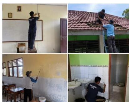
Gambar 3. Kegiatan Perbaikan Sarana dan Prasarana Sekolah

Hasil dokumentasi menunjukkan bahwa pelaksanaan perbaikan sarana dan prasarana di SMA Negeri 2 Lais telah dilakukan secara rutin sesuai dengan kondisi fasilitas sekolah. Terdapat dokumentasi kegiatan perbaikan ruang kelas, fasilitas belajar siswa, serta fasilitas pendukung lainnya oleh pihak sekolah. Dokumentasi tersebut juga memperlihatkan keterlibatan kepala sekolah dan petugas sarana prasarana dalam memastikan fasilitas sekolah tetap dalam kondisi baik dan layanan digunakan.