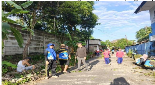
Gambar 6. Kegiatan Gotong Royong Siswa

Hasil dokumentasi menunjukkan adanya kegiatan gotong royong siswa, kegiatan kebersihan lingkungan sekolah, serta berbagai aktivitas pembinaan karakter yang dilaksanakan secara rutin. Dokumentasi tersebut berupa foto kegiatan yang memperlihatkan keterlibatan siswa dalam menjaga kebersihan dan ketertiban lingkungan sekolah sebagai bagian dari program pembiasaan disiplin.