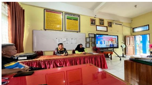
Gambar 4. Kepala Sekolah Melakukan Pengawasan Kegiatan Sekolah

Hasil dokumentasi menunjukkan adanya kegiatan pengawasan yang dilakukan kepala sekolah terhadap berbagai aktivitas sekolah yang berkaitan dengan pelaksanaan disiplin siswa. Dokumentasi tersebut berupa foto kegiatan kepala sekolah saat melakukan pengawasan terhadap siswa dan guru dalam menjalankan tata tertib sekolah.