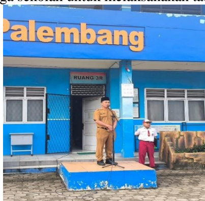
Gambar 5. Kepala Sekolah Memimpin Apel Pagi

Hasil dokumentasi menunjukkan adanya kegiatan kepala sekolah dalam memimpin apel pagi dan memberikan arahan kepada siswa maupun guru terkait pentingnya kedisiplinan di sekolah. Dokumentasi tersebut berupa foto kegiatan yang memperlihatkan keterlibatan langsung kepala sekolah dalam menggerakkan seluruh warga sekolah untuk melaksanakan tata tertib dan menjaga kedisiplinan.