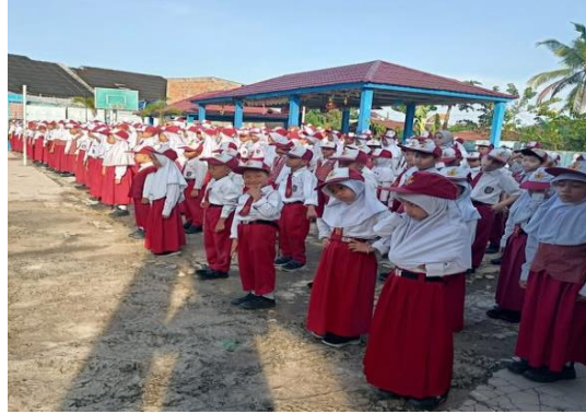
Gambar 7. Pembinaan Disiplin Siswa

Hasil dokumentasi menunjukkan adanya kegiatan pembinaan disiplin siswa dan pengarahan yang dilakukan kepala sekolah kepada siswa. Dokumentasi tersebut berupa foto kegiatan yang memperlihatkan keterlibatan kepala sekolah dalam memberikan motivasi, nasihat, dan pembinaan kepada siswa sebagai bagian dari upaya meningkatkan disiplin di sekolah.