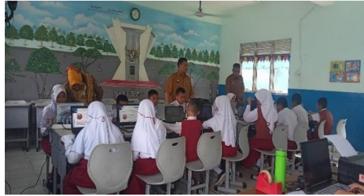
Gambar 1. Kepala Sekolah Memberikan Arahan kepada Siswa

Berdasarkan dokumentasi pada Gambar 1 dapat disimpulkan bahwa kepala sekolah terlibat secara langsung dalam kegiatan pembinaan disiplin siswa. Dokumentasi tersebut menunjukkan adanya upaya nyata kepala sekolah dalam menanamkan nilai-nilai disiplin melalui pengarahan, pembinaan, dan pengawasan yang dilakukan secara berkelanjutan kepada siswa.