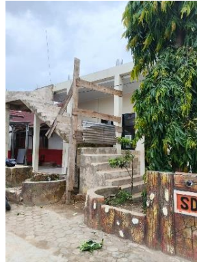
Dokumentasi 2. Bangunan Sekolah yang Masih dalam Tahap Pembangunan sebagai Upaya Pengembangan Fasilitas Pendidikan

Hasil penelitian menunjukkan bahwa proses perencanaan dan pengadaan sarana prasarana di SDN 8 Talang Kelapa telah dilakukan melalui musyawarah sekolah dengan melibatkan kepala sekolah, guru, dan tenaga kependidikan lainnya. Kebutuhan fasilitas sekolah disusun berdasarkan skala prioritas dan disesuaikan dengan kemampuan anggaran sekolah yang sebagian besar berasal dari dana BOS dan bantuan pemerintah. Keterlibatan guru dalam memberikan usulan terkait kebutuhan fasilitas pembelajaran menunjukkan adanya kerja sama antara pihak sekolah dalam memenuhi kebutuhan pembelajaran siswa.