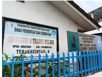
Dokumentasi 3. Gerbang Depan dan Identitas SDN 8 Talang Kelapa sebagai Identitas Resmi Sekolah

Dokumentasi berupa buku inventaris dan laporan pemeliharaan fasilitas menunjukkan bahwa sekolah telah melakukan pencatatan dan pemeliharaan fasilitas sekolah secara berkala sebagai bentuk pengawasan terhadap kondisi sarana dan prasarana pendidikan.