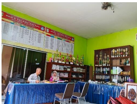
Dokumentasi 4. Ruang Guru SDN 8 Talang Kelapa sebagai Tempat Administrasi dan Koordinasi Pendidik

Dokumentasi kegiatan sekolah menunjukkan bahwa fasilitas sekolah dimanfaatkan secara aktif dalam mendukung kegiatan pembelajaran dan aktivitas pendidikan lainnya yang dilaksanakan di sekolah.