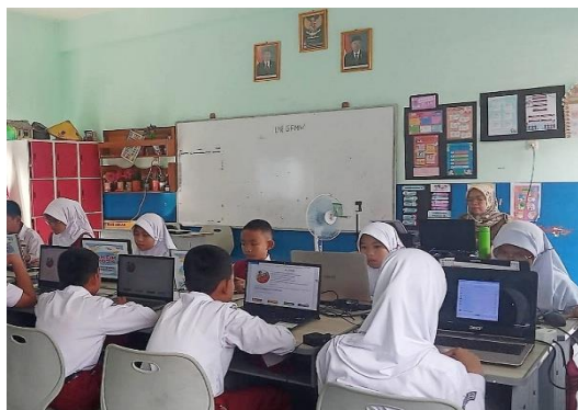
Gambar 1. Kegiatan Pembelajaran Siswa di Kelas

Selain itu, hasil penelitian juga dibuktikan melalui dokumentasi penelitian berupa kegiatan wawancara dengan kepala sekolah serta kegiatan pembelajaran siswa di kelas. Dokumentasi tersebut menunjukkan adanya proses perencanaan pembelajaran yang dilakukan guru melalui penyusunan tujuan pembelajaran sebelum kegiatan belajar mengajar berlangsung. Dokumentasi kegiatan pembelajaran juga memperlihatkan siswa mengikuti pembelajaran dengan tertib dan aktif di dalam kelas.