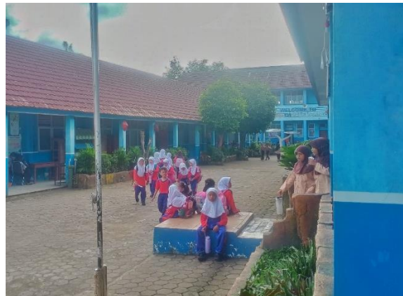
Gambar 2. Kondisi Lingkungan SD Negeri 131 Palembang

Selain itu, hasil penelitian juga dibuktikan melalui dokumentasi penelitian berupa kondisi lingkungan sekolah dan keadaan sekolah SD Negeri 131 Palembang. Dokumentasi tersebut menunjukkan bahwa lingkungan sekolah memiliki suasana yang cukup nyaman dan mendukung proses pembelajaran siswa sehingga membantu guru dalam memahami serta menyesuaikan pembelajaran dengan kondisi siswa.