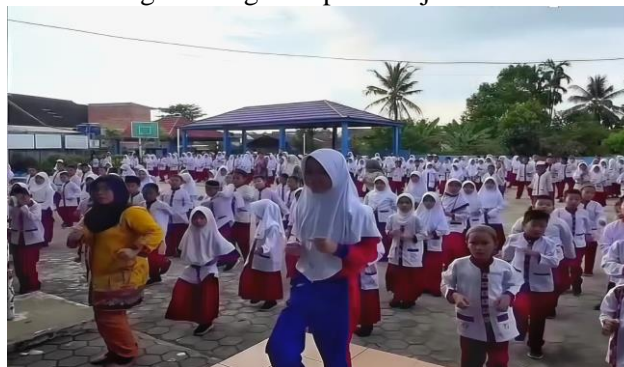
Gambar 4. Kegiatan Senam Pagi Siswa SD Negeri 131 Palembang

Selain itu, hasil penelitian juga dibuktikan melalui dokumentasi penelitian berupa kegiatan senam pagi siswa SD Negeri 131 Palembang. Dokumentasi tersebut menunjukkan adanya kegiatan positif yang dilakukan sekolah untuk membangun semangat, kedisiplinan, serta meningkatkan motivasi belajar siswa sebelum mengikuti kegiatan pembelajaran di kelas.